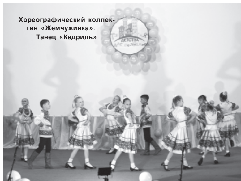
Хореографический коллектив «Жемчужинка». Танец «Кадриль»