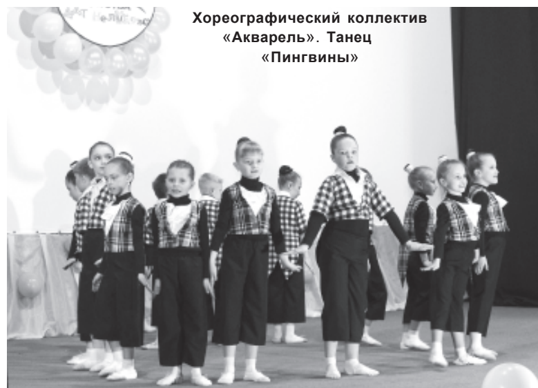
Хореографический коллектив «Акварель». Танец «Пингины»

ОТЧЕТНЫЙ КОНЦЕРТ ХОРЕОГРАФИЧЕСКОГО КОЛЛЕКТИВА «АКВАРЕЛЬ»