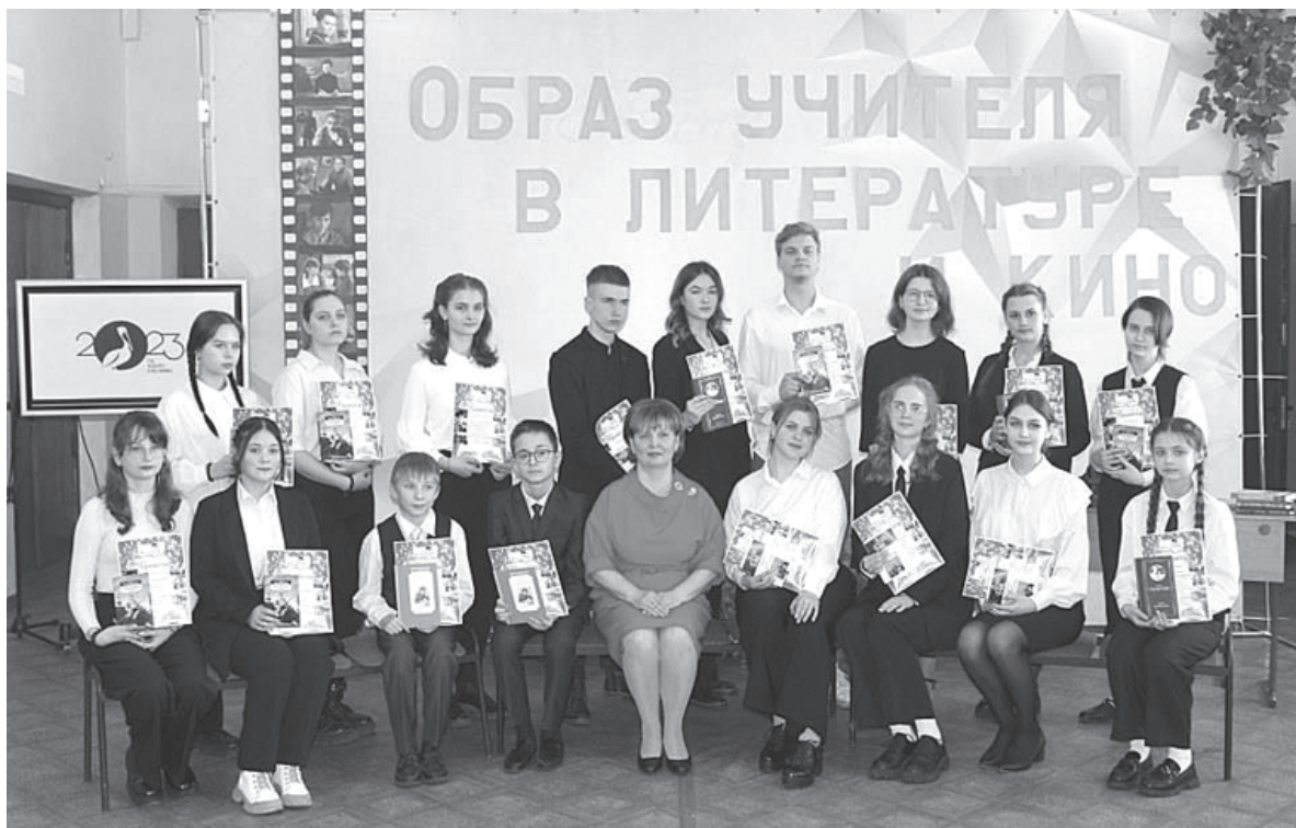
Участники читательской конференции «Образ учителя в литературе и кино»

Я присутствовал на секции «Слово во славу Учителя», посвящённой учителям Нелидовского