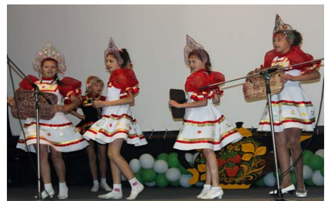
Участники программы: хореографический коллектив "Жемчужинка"; клуб "Вальсок".