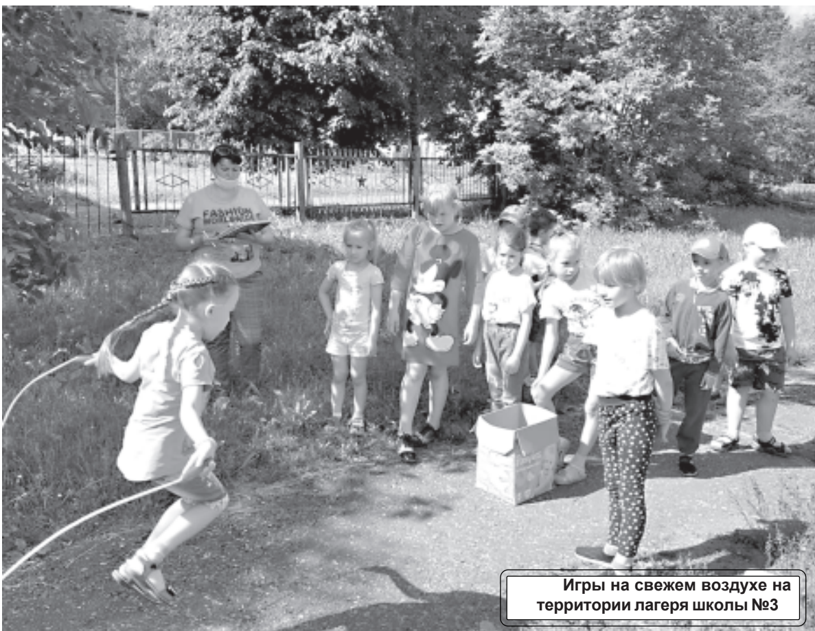
Игры на свежем воздухе на территории лагеря школы №3